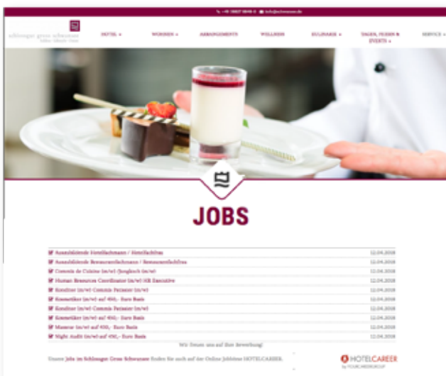
Auf Ihrer Webseite